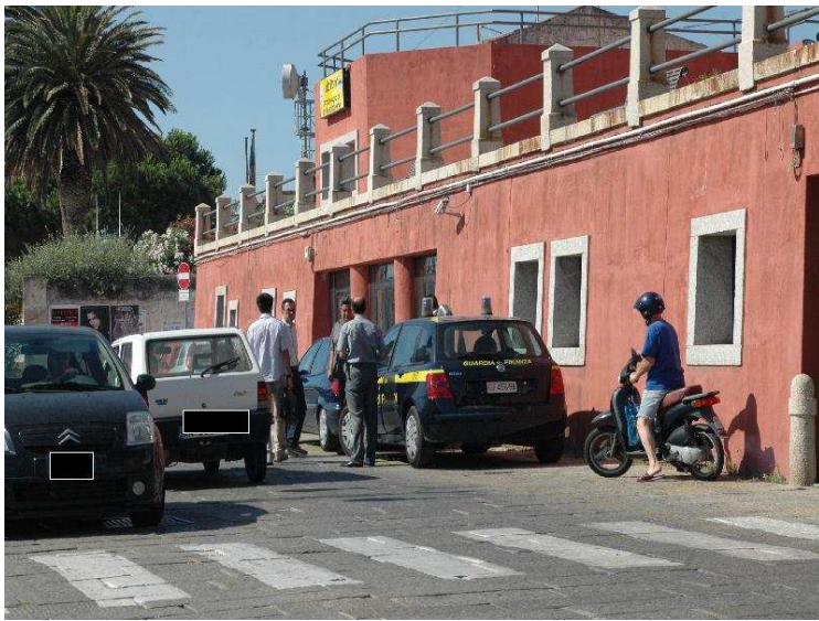
Gli uomini della Guardia di Finanza